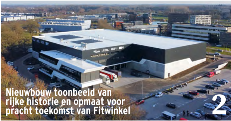
Nieuwbouw toonbeeld van rijke historie en opmaat voor pracht toekomst van Fitwinkel