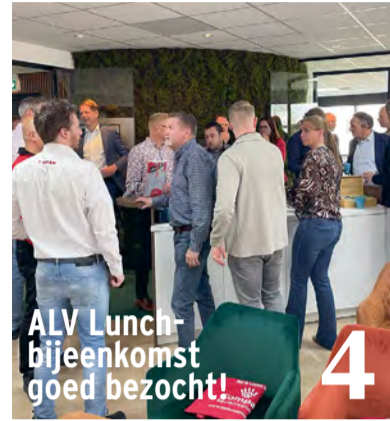
ALV Lunchbijeenkomst goed bezocht!